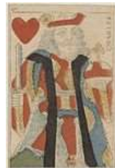
En gammel konge fundet i kasematterne under Kronborg