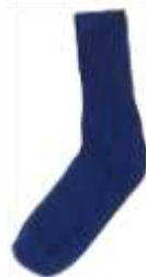
Illustration er indsat af redaktionen, dog ikke for at provokere.

Redaktionen har ikke kunnet identificere afsender, da indlægget er modtaget med snail – mail uden afsender men med poststempel Slagelse.