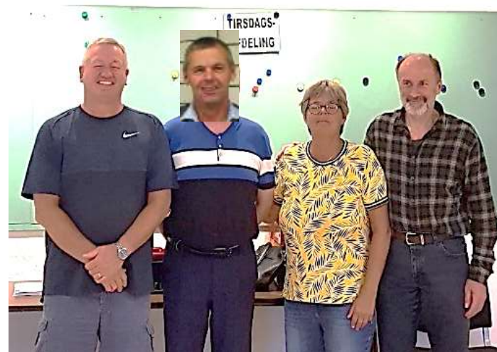
Husker du billedet af distriktets vindere fra september nummeret ???

Vi kan så prale af, at vi faktisk slå dem med 15 - 5 efter flere gode spil, bl.a. dette spil: