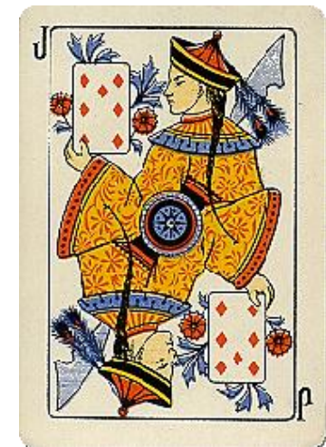
Ak ja, de kinesere

Her er et sjovt kort. Er det ruder 7 - eller som J i siderne antyder - en bonde? Mit gæt er, at det er ruder bonde, der har fået sidste stik på ruder 7 ☺.